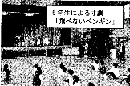
6年生による寸劇 「飛べないペンギン」

5月31日の朝会は、全校道徳を行いました。全校道徳は、本校独自の取組です。まず、朝会で、校長が全校児童に向けて道徳を行い、その後、学級担任が内容を深めていきます。各学期に1回、実施しています。