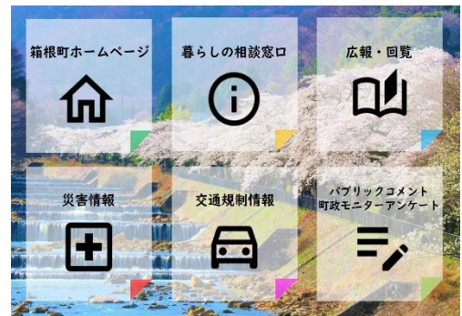
箱根町公式 LINE メニュー

LINE の他にも、ホームページ、メールマガジン、TVK データ放送で防災行政無線の放送内容を配信しています。