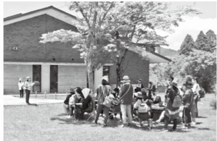
過去に行われた森林セラピーツアーの様子