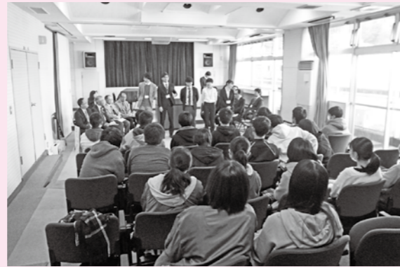
講師からの激励の言葉