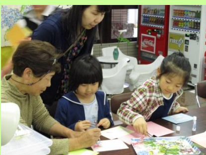
押し花絵体験！真剣です