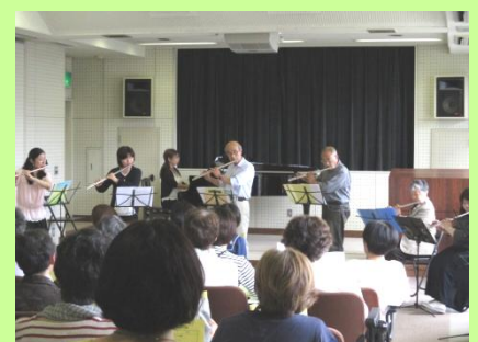
トークも絶妙なフルートの演奏