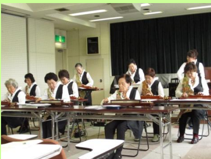
大正琴の演奏を楽しんだ後は…