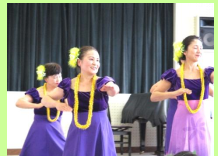
素敵な笑顔で気分は南国♪