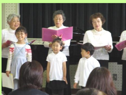
温泉幼稚園のおともだちと一緒に！