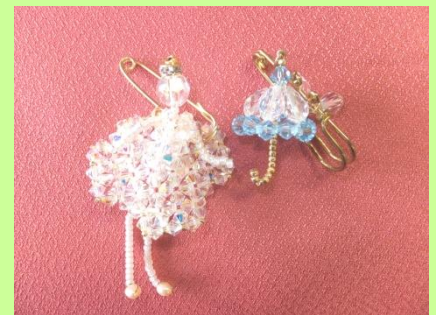
ビーズ細工（ポスター掲載作品）