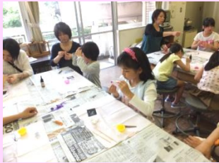
楽しく制作できました

今回は前半を小学生の部、後半を大人の部としてそれぞれ募集をしました。小学生の部は初めての開催でしたが、みなさん一生懸命取り組んでくれました。夏にぴったりの、かわいらしいヘアピンができました。