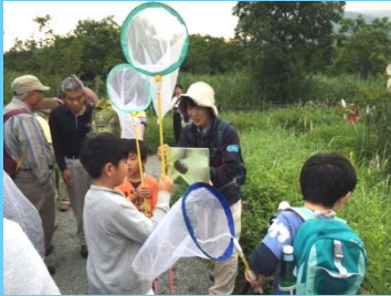
昆虫のパネルを用意していただきました

この日は肌寒い日でしたが、オオルリハムシをはじめ、今回の観察の目的であるミドリシジミなど、湿原の仲間たちがたくさん姿を見せてくれました。