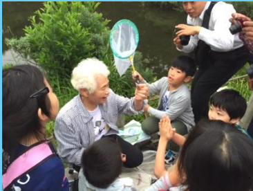
マーキングってなんだろう?