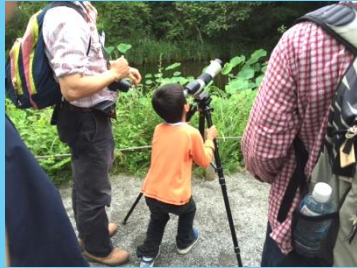
ミドリシジミ、見えたかな?