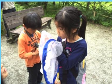
真剣に観察しています