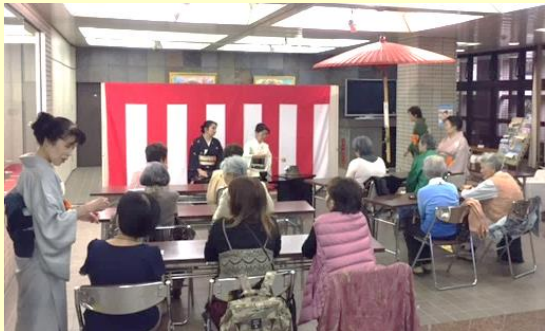
お茶の点て方も教えてくださいました

この日はちょうど十三夜だったので、“月”にちなんだ和菓子と一緒に、お茶をたのしみました。