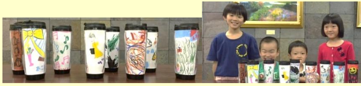
一生懸命デザインを考えました

9/24(土)、大文字クラブで“お絵かきボトル”を作りました。型紙に絵を描き、型のとおりに切り取ってボトルの中に入れれば完成です。自分の名前を入れたり、好きなものをたくさん描いたりして、自分だけのボトルを作りました。