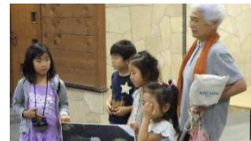
草原の昆虫のパネルを見ながら、お話を聞きました