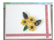
(作品例：メッセージカード)