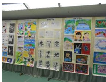
園児・小中学生作品