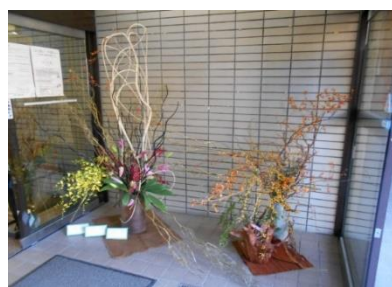
華道連盟玄関迎え花の作品

11/8(金)～10(日)の3日間、社会教育センターで箱根町民文化祭を開催しました。町文化団体連絡協議会のみなさんをはじめ、みなさんから募集した作品が館内いっぱい展示されました。芸術と山々の紅葉が箱根の秋をいろどる、素晴らしい3日間となりました。その一部をお届けします。