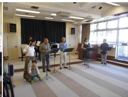
フルーツアンサンブル はこねの皆さんの演奏