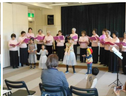
コールフレンドの みなさん