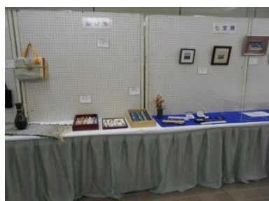
織物・七宝の作品