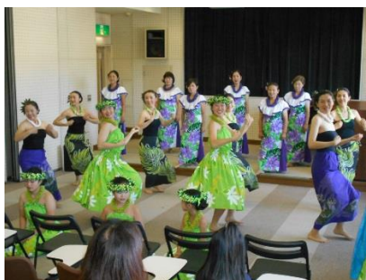
フラ アオ ラニ の みなさん