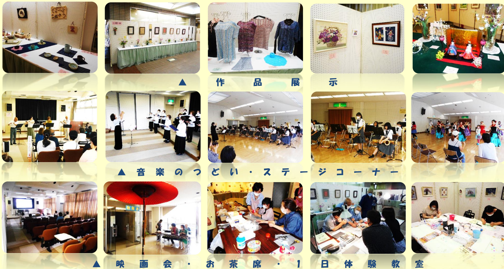
作 品 展 示