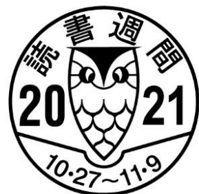
▲第 75 回 読書週間マーク

「読書週間」とは、公益社団法人読書推進運動協議会主催の読書推進活動です。まだ戦争の傷あとが日本中のあちこちに残っている1947(昭和22)年に、「読書の力によって、平和な文化国家を創ろう」と、出版社・取次会社・書店と図書館が力をあわせ、第1回「読書週間」が開かれました。それから70年以上が過ぎ、「読書週間」は日本中に広がり、日本は世界のなかでも特に「本を読む国民」の国となりました。(公益社団法人読書推進運動協議会公式ホームページより)