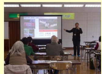
▲第6回講義「観光資源と箱根観光のこれから」

今年度は新型コロナウイルス感染症の影響により、2年ぶりの開催となりました。関係者の皆様のご協力により、無事に終了できたことに感謝申し上げます。