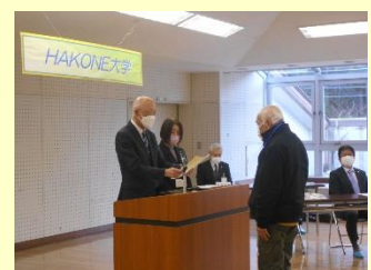
▲閉講式(修了証の贈呈)