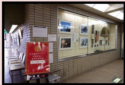
▲展示入れ替えを行った書道と写真作品