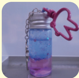
▲チャームボトル（午後）