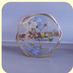
▲ポタニカルブローチ（午前）

シーリングスタンプで作るブックマーカー（本にはさむしおり）や、かわいらしいチャームボトル、押し花などのさまざまな素材を封じ込めたポタニカルブローチを作ります。オリジナルのハンドクラフト作品制作を、一緒にプチ体験してみませんか？