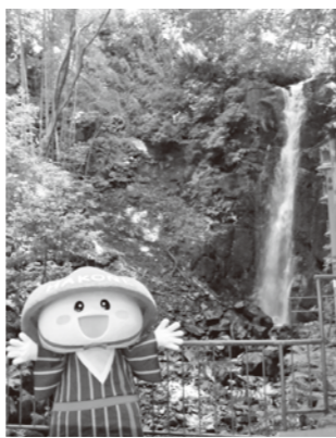
真夏でも涼しげな不動滝

ちょうど今、県立生命の星・地球博物館で特別展「Minerals in the Earth—大地からの贈り物—」が開催されていて、様々な鉱物について学べるよ。夏休みの宿題に箱根ジオパークのジオサイトや県の石を調べてみると面白いかもね！