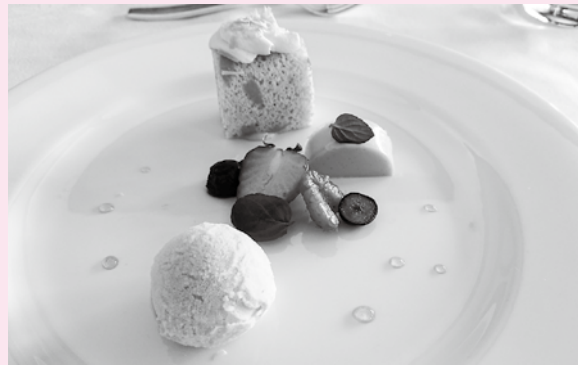
卒業記念会用にアレンジされた箱根スイーツ