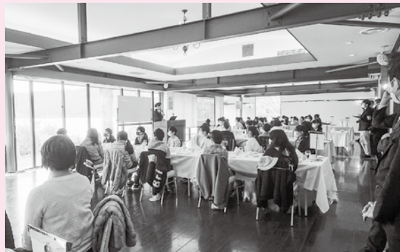
山のホテルのスタッフの話を聞く子ども達