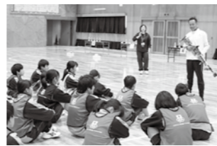
照会先 企画課 ☎85-9560