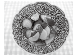
1人分の栄養価 エネルギー:25kcal 蛋白質:1.1g 脂質:1.1g 食塩相当量:0.5g

きゅうりはウリ科の野菜で、熟すと黄色くなる(黄瓜)ことから名前の由来になったとされています。 栄養価は、主にビタミン、ミネラルを含み、特にカリウムが豊富です。 きゅうりは太さが均一で、頭の部分が硬く、イボがとがっているものを選びましょう。 照会先 さくら館 ☎85-0800