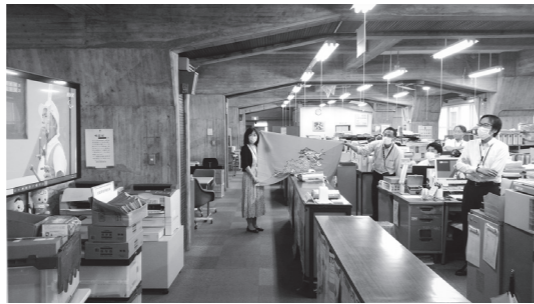
役場でもライブ配信を観戦し、応援しました。

※1 S K Yプロジェクトに係る実行委員会（神奈川県、小田原市、箱根町、大磯町および星槎グループ）は、ホストタウン相手国（エリトリア国、ブータン王国およびミャンマー連邦共和国）との交流などを通じて、地域における（S）スポーツの振興、（K）教育文化の向上、（Y）友好関係の構築を図ることを目的として設置しました。