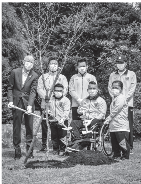
勝俣町長とブータン選手団