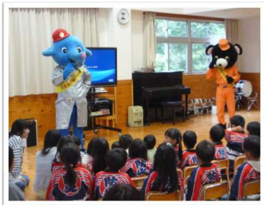
ポンプ君とレスキュー君の防火広報