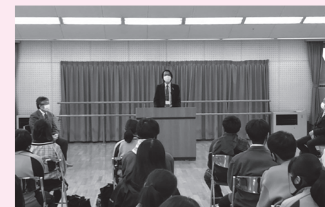
運営スタッフからの激励の言葉

◇受講生の皆さん、お疲れ様でした。4月から、実り多い充実した学校生活を送れることを願っています。 ◆新中学3年生の皆さん、5月に、令和3年度 箱根土曜塾の受講生を募集します。箱根土曜塾で、仲間と一緒に受験勉強を頑張りませんか？皆さんからの申し込み、お待ちしております！