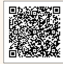
箱根町ホームページへのリンク

webサイトの開発には各交通事業者の許諾を得て、ホームページ情報等を利用させていただき、関連情報の一元化を実現することができました。