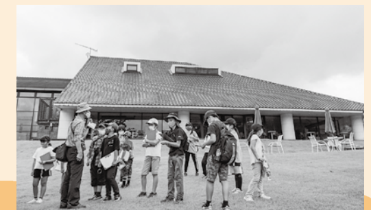
ホテルのお庭で生きもの観察!