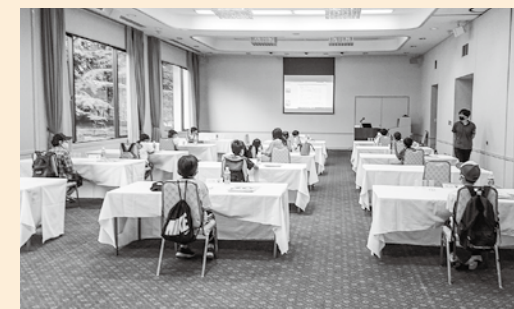
箱根ジオパークについて学んだよ