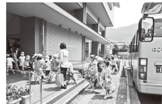
※湯小と湯幼と一緒にスクールバスを利用して、さくら館プールに行きました。

消防の仕事 No. 4 第4回は「消防救助技術指導会」の紹介をします。消防救助技術指導会とは、何時、どこで起こるかわからない災害に備えるため消防救助活動に不可欠な体力、精神力および技術を習得するとともに、部隊訓練を行うことで災害に打ち勝つチームワークを養うことを目的としています。また、全国の消防救助隊員が一堂に会し、訓練技術を競い合うことで他の模範となる消防救助隊員を育成し、消防に寄せる期待に力強く応えることを主として毎年実施されています。 競技は陸上の部、水上の部に別れており、陸上の部にはロープブリッジ渡過、はしご登はん、障害突破等7種目があり、水上の部には基本泳法、溺者救助、水中検索救助等の7種目があります。 箱根町消防本部では陸上の部のロープブリッジ救出訓練を行っており、計2隊、8人の隊員が、8月24日(水)愛媛県松山市で開催される、第45回全国消防救助技術大会への出場を目指し日々訓練に励んでいます。