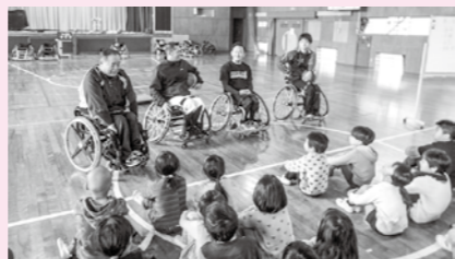
講師の方々の話を聴く子ども達(湯本小学校)