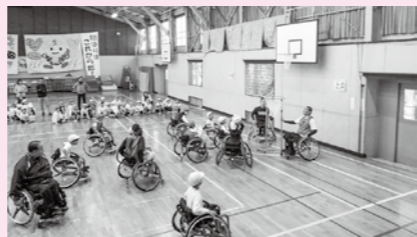
車いすバスケットボールを体験する子ども達(仙石原小学校)