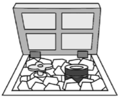
発砲スチロールや新聞紙をつめてください。

寒さが厳しくなり気温が0℃以下になると、水道管や蛇口、メーターが凍りやすくなり、凍結による器具の破損や、ひび割れが起こる可能性があります。止水栓からお客様側のメーター等、器具が破損した場合にかかる費用などはお客様の負担となります。真冬などは、水道管や蛇口の凍結防止に努めましょう。 ※凍結を防止するには ・発泡スチロールを砕いたものなどを、メーターボックスの中に詰めて保温しましょう。