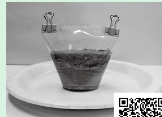
マグマの流れの再現実験。マグマの噴き出す様子を観察してみてね。