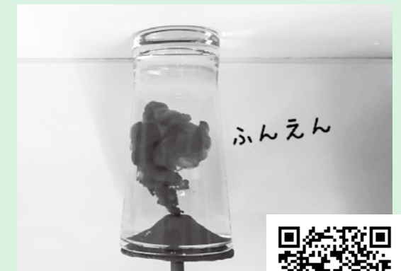
火山の噴火実験は、スポイトから噴き出すものによって噴火で起きる出来事が再現できるよ。