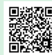
ジオってみよう！パンフレット