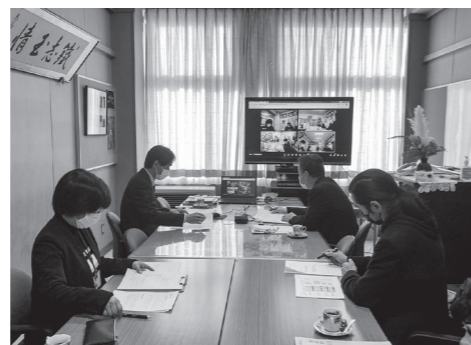
学校運営協議会の様子(箱根の森小学校にて)

地域の皆さんには、これまでも様々なかたちで学校運営に協力していただいておりますが、学校運営協議会において協議しながら、地域の皆さんとともに、一貫教育をさらに推進していきたいと考えています。