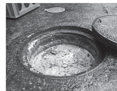
油で詰まった公共樹(町内での事例)

新就学児童・生徒の保護者の皆様へ 今春小学1年生になる児童、または中学1年生になる生徒がいる家庭に、1月11日付けで就学通知書を郵送しています。 入学式当日、就学通知書を必ず持参してください。就学通知書が届いていない場合は、問い合わせてください。 対象児童・生徒の生年月日 ○小学1年生…平成27年4月2日～平成28年4月1日 ○中学1年生…平成21年4月2日～平成22年4月1日 照会先 教育委員会学校教育課 ☎85-7600