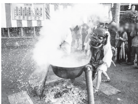
仙石原湯立獅子舞

箱根の湯立獅子舞は、これまで神奈川県無形民俗文化財として指定されています。1月21日に開催された国の文化審議会で、宮城野地域と仙石原地域で守り伝えられている国の記録選択無形民俗文化財「箱根の湯立獅子舞」(保護団体・箱根湯立獅子舞保存会)を、国の重要無形民俗文化財に指定するよう文部科学大臣に答申がなされました。湯立獅子舞は、江戸時代に箱根に伝えられたといわれる湯立神楽です。全国に分布する湯立神楽の中で、箱根の湯立獅子舞は、獅子頭を被ったものが、幣束やササを用いて釜の湯をかき混ぜ、集まった人々などへ湯を振りかけて祓い清める「湯立」の所作を行うもので、現在箱根町と静岡県御殿場市にのみ伝わっているたいへん希少な芸能です。また、湯立の前日や別日に、悪疫払いを目的とした辻締めを行うことも大きな特色のひとつです。