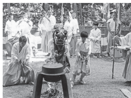
宮城野湯立獅子舞

財として指定されるなど、保護が図られてきましたが、その価値がさらに高く評価されたもので、この度、箱根町で初めての国重要無形民俗文化財に指定されることとなります。 照会先 教育委員会生涯学習課(文化財係) ☎8517601