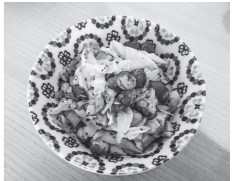
1人分の栄養価 (いんげんまめで計算) エネルギー：204kcal たんぱく質：7.7g 脂質：12.4g 食塩相当量：0.6g