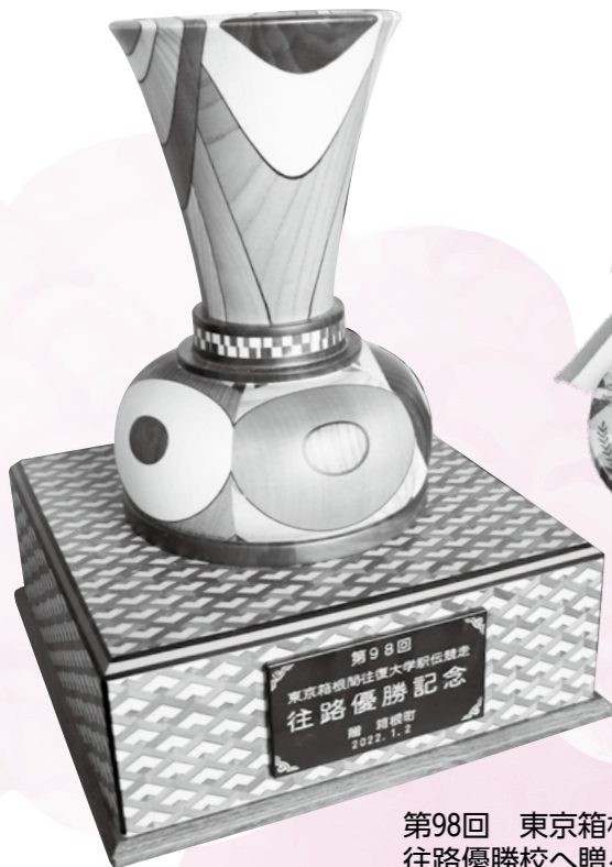
第98回 東京箱根間往復大学駅伝競走 往路優勝校へ贈る奇木のトロフィーとメダル

夏には1年延期となっていた東京2020オリンピック・パラリンピックが開催されました。残念ながら無観客での開催ということとなり、国内はもとより、世界中から多くのお客様に本町を訪れていただき楽しんでいただこうという願いは実現されませんでした。日本をはじめとする世界の躍動する姿や活躍は世界の希望の灯をともしてくれました。10月には緊急事態宣言が解除され、段階的に行動制限が緩和されましたので、本町においても徐々に観光地の賑わいが戻りつつあると感じています。