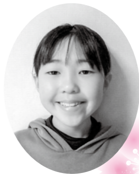
箱根で夢を叶える

箱根で生まれ育って36年目。今は妻と二人で仕事や子育てに楽しく奮闘中です。 仕事は芦ノ湖で海賊船の船員をしています。船の状態や天候を見ながら、常に安心・安全なサービスを提供することは簡単ではありませんが、四季の変化や観光客の皆さんの状況から、常に「箱根の今」を実感できること、お客様から「かっこいい!」「ありがとう!」と言っているだけで、私にとって何よりの励みであり、町民としての誇りです。 コロナ禍で仕事も生活も大変な状況でしたが、本年はなんとか終息に向かってもらい、仲間たちと楽しく日々を過ごせたらと思います。 3回目の年男・年女のみんな! 2022年もこれからも、「みんななかよし」でいこーぜ!