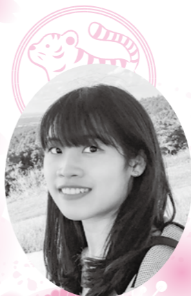
箱根町での1年とこれから

縁あって2017年夏に箱根に移住し、今年は5年目となります。最初の半年は湯本で生活し、その後仙石原へ移り住みました。箱根の冷涼な気候とふんだんに供給される温泉に、日々感謝して過ごしています。 昨年は、夫の実家の建物を使い仙石原に「本喫茶わかば」という名前の読書カフェを開業しました。古書販売と喫茶店を合わせたもので、店内で本を読むこともできます。 10年前から箱根町に関わるようになり、次第に、人の輪の広がりを実感しています。今年も「箱根に住もう」を合言葉に、一層盛り上げていければいいなと思っています。