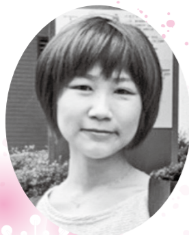
仙石原で楽しく暮らす

新年明けましておめでとうございます。 私は今年で6年生になります。去年は新型コロナウイルスが急増して友達と遊ぶのも距離を取らないといけませんでしたが、小学校も通うのもあと1年しかないので思いっきり遊んで楽しみたいです。 そして箱根の自然にも親しみたいです。 私の将来の夢は警察官になってバイクに乗ることです。バイクに乗って駅伝の走者の先導をしたいです。警察官になるためにたくさん勉強して、一歩でも近づけるように頑張りたいです。