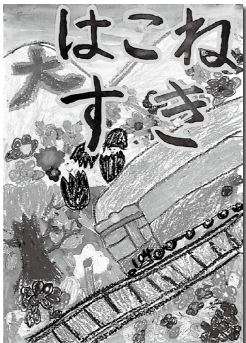
啓発用ポスターに採用された作品