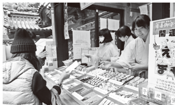
中学1年生の町内職場体験「箱根の良さを体験」