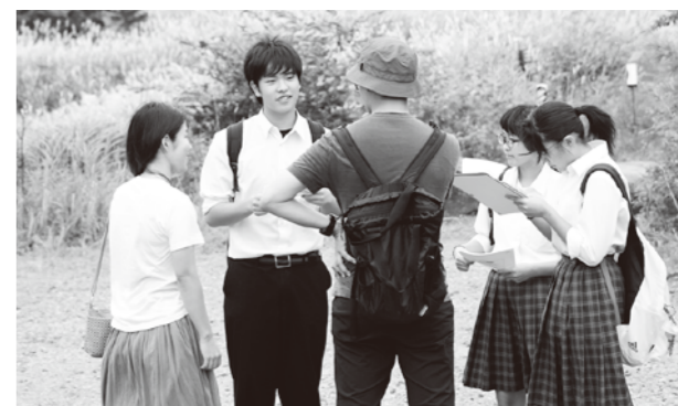
中学3年生の観光客インタビュー「箱根の良さをPR!」