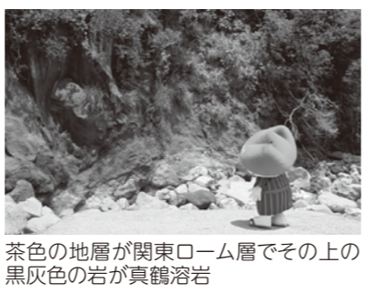
茶色の地層が関東ローム層でその上の黒灰色の岩が真鶴溶岩

みんな、今年もオイラと一緒に箱根ジオパークのジオサイトを見て回ろうね！よろしく〜♪