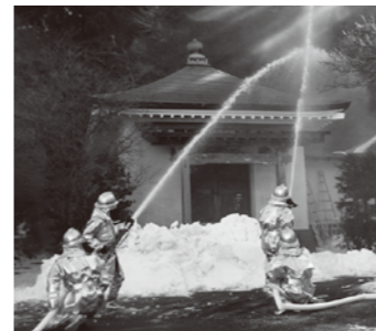
平成28年1月に行った訓練の様子(興福院)

町では、貴重な文化財を火災や震災などから守り後世まで伝えていくため、毎年この日に合わせて防火訓練を行っています。今年は1月25日(水)に、国の登録文化財である神山荘(強羅)での訓練を予定しています。