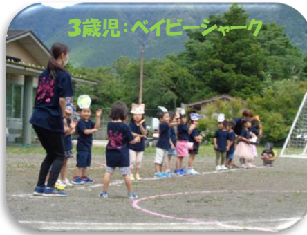
3歳児：ベイビーシャーク