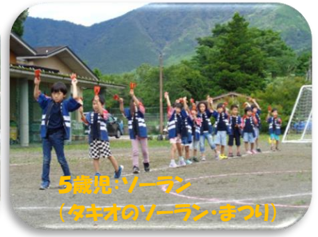
5歳児：ソーラン (タキオのソーランまつり)

続いて保護者会の趣向を凝らしたお店(ボーリング、的当て、ドラえもんどら焼きパクパクなど)、さくら組の「ぜったい当てるぞ! 的当てゲーム」「ぜったい釣るぞ! 大物ゲーム」を人が分散できるようにウォークラリー形式で楽しみました。地域のお店の協力もあり、焼きそば、パン、スイーツなど持ち帰り用でしたが飲食のお店も出店されました。感染拡大が懸念されていますが、検温、クラス毎の入口、各お店にアルコール消毒を置くなど感染対策をしたうえで保護者2人までにしました。