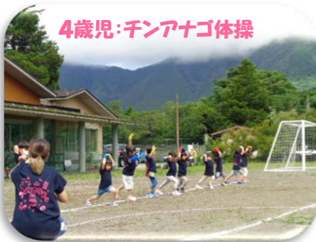
4歳児：チンアナゴ体操

7/7 たなばたに納涼大会を開催しました。オープニングは、 4歳児：チンアナゴ体操 ⇒ 3歳児：ベイビーシャーク ⇒ 5歳児：ソーラン を表現して、1学期の子ども姿をご覧いただきました。保護者の皆さんに見ていただくことを楽しみにしていました。かわいい表情で踊る姿、自信たっぷりに張り切って踊る姿が見られました。緊張していた子どもや大勢の人に見られることが苦手な子どももいましたが、日常では意気揚々と躍ったり、成長と共に少しずつ慣れていったりしますので、次の機会にどのような姿が見られるか楽しみにしてください。