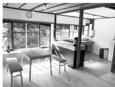
移住体験交流施設 cotoha

A 企画課長 神奈川県内の状況は、6市町村で外壁塗装の助成金制度がある。今後研究したいと考える。