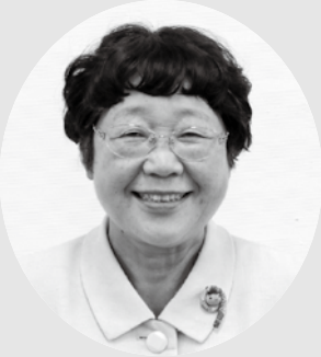
1 山田 和江 議員

①宮城野310 ②82-1792 ③日本共産党 ④日本共産党(10回) ⑤料理研究、読書、温泉地めぐり ⑥これからの4年間、掲げた公約実現のため、「住民こそ主人公」の立場でみなさんと力を合わせ全力をつくします。高校生までの医療費無料化、高齢者の交通費負担軽減、保育園、学童保育の充実、災害対策、湿生花園の町直営化等の実現をめざし国に対しても観光地の負担軽減を求めて参ります。平和産業発展のため憲法9条を守るためにも全力をつくします。