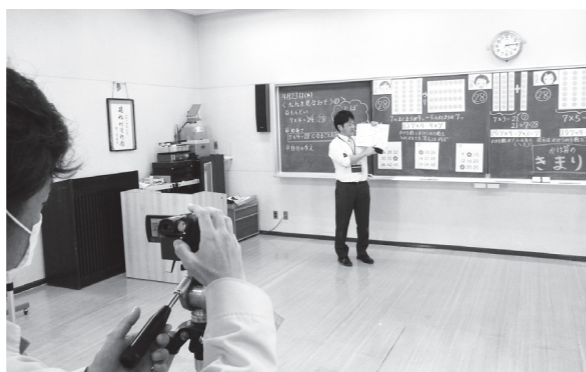
DVD授業を撮影する様子