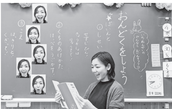
学校のホームページに掲載されている先生方からのメッセージ