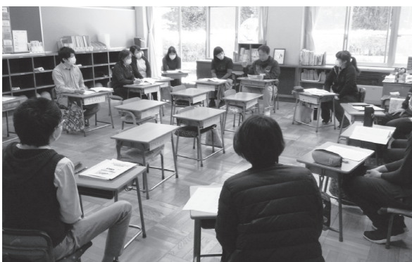
学校での先生方の話し合いの様子

今後どうなっていくのかを見通すことは難しい状況ですが、引き続き各学校と教育委員会が連携・協力し、子ども達の健康と感染防止を第一に考えつつ、子ども達の学習等を支援していきます。