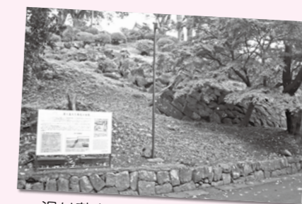
滑り落ちた小田原城本丸の石垣

みんなもぜひ小田原市郷土文化館や小田原城に遊びに来てね！ さあ～て、次はどこに行ってみようかな。 ※小田原市郷土文化館は1月3日(休)まで臨時休館。