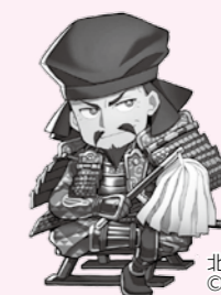
北条早雲

新年あけましておめでとうございます！2019年みんなはどのような一年にしたいかな？ 今月は、箱根ジオパーク小田原エリアにある拠点施設「小田原市郷土文化館」にやってきましたよ。ここは、小田原市内の発掘調査で出てきた考古資料や郷土小田原の自然や歴史に関する資料を集めて、展示している施設だよ。 郷土文化館のある小田原城址公園には、ジオサイトの小田原城もあるんだ。小田原城は、箱根外輪山からつづく丘陵の先端に位置していて、その地層は箱根火山から噴き出した火砕流と軽石の火山灰からできているよ。戦国時代に活躍した小田原北条氏は、この箱根火山の火山灰が堆積した関東ローム層を、お城の土塁と堀に利用したんだ。関東ローム層は水を含むと滑りやすくなるから、なかなか登れないんだって！だからお城の防御に最適だったんだね。