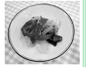
1人分の栄養価 エネルギー:28kcal 蛋白質:0.9g 脂質:0.6g 食塩相当量:0.3g

パプリカは、赤や黄色等さまざまな色があり、植物学的にはトウガラシの仲間です。ピーマンに比べて肉厚でサイズが大きく、甘みがあります。栄養価は、ビタミンCやカロテンなどを多く含みます。色が鮮やかで張りがあり、つややかでずっしりと重みがあるものを選びましょう。 照会先 さくら館 ☎85-0800