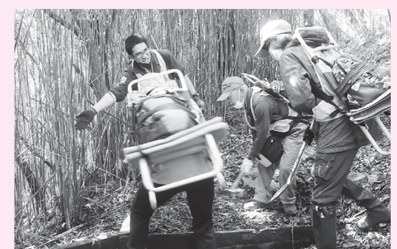
水切りにたまった土をかきだすよ