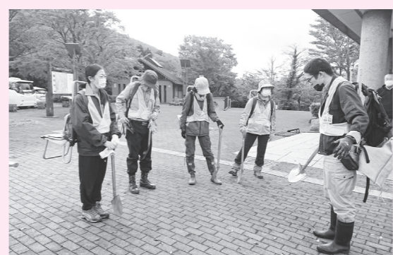
第1回サポーター講座の様子 スコップを担いで出発!