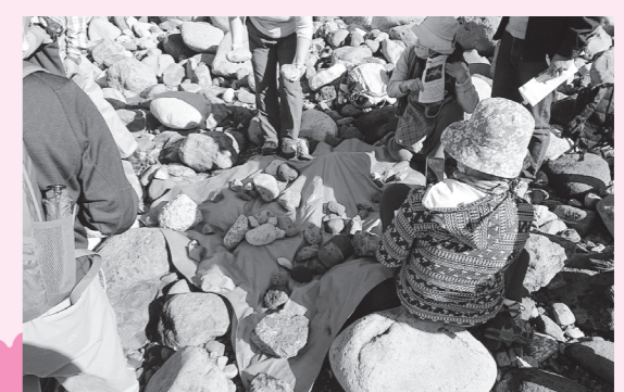
川の石を集めて違いを観察したよ