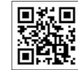
コロナワクチンナビ 2次元コード

接種後に箱根町へ転入した方は接種券が発行されませんので申請が必要です。申請は、「コロナワクチンナビ」からも行えます。