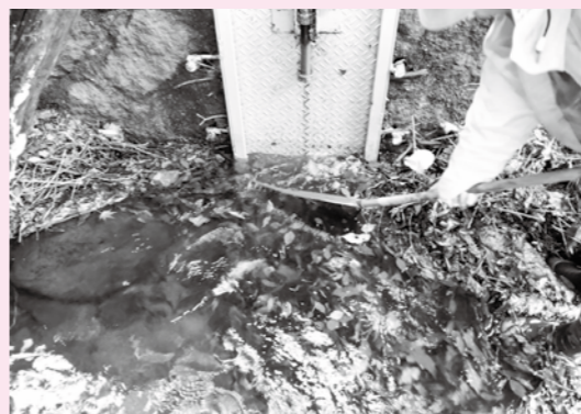
水路が詰まってしまうように落ち葉掃除を行います。

3月のサポーター講座ではこの地蔵堂周辺や水かけ菜の紹介をする予定です。講座では水かけ菜の話だけではなく、地蔵堂地区と箱根町の意外な関係についてのお話も予定しております。日時などが決まりましたら広報はこねや箱根ジオパークホームページでお知らせしますので、ぜひ参加してください。