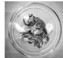
栄養価(1人分) エネルギー: 94kcal 蛋白質: 13.7g 脂質: 2.7g 食塩相当量: 0.8g