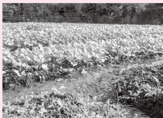
シカの被害も目立たず、生育は順調です。