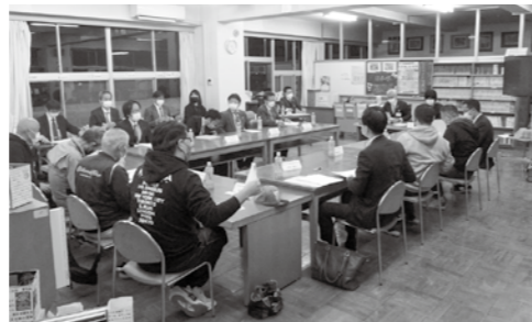
検討委員会の様子

令和7年度にはリニューアルした湯本小学校が完成しますので、教育内容だけではなく、施設面も充実させ、引き続き一貫教育に取り組んでいきたいと思っております。