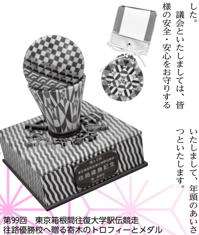
第99回 東京箱根間往復大学駅伝競走 往路優勝校へ贈る奇木のトロフィーとメダル