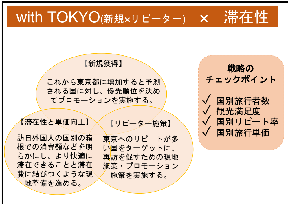
【海外観光戦略イメージ図】