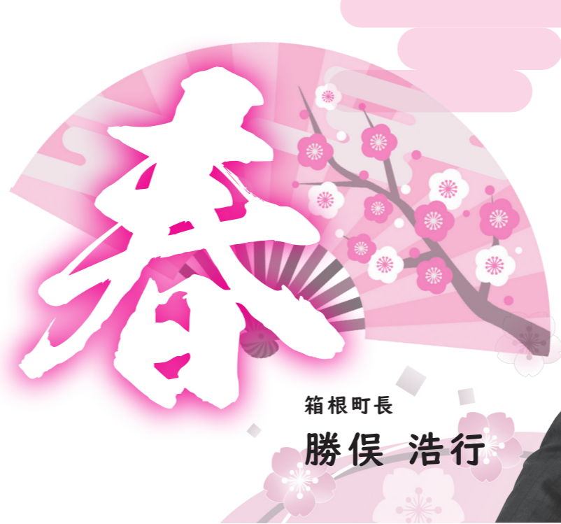
箱根町長 勝俣 浩行