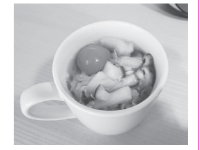
電子レンジでも 作れるレシピ 1人分の栄養価 エネルギー:29kcal 蛋白質:1.7g 脂質:0.4g 食塩相当量:1.2g

平成31年3月に策定した健康づくりや食育に関する計画「箱根町健康増進計画・食育推進計画(第2次)」では、特に、若い世代(概ね20歳から39歳まで)において、『朝食を欠食する人の割合』の増加や『主食・主菜・副菜をそろえた食事』の摂取頻度の減少などが見受けられ、栄養バランスに配慮した食生活を実践することが困難な状況にあります。 適切な量や質の食事は、生活習慣病の予防や生活の質(QOL)の向上に、大きな役割を果たすだけでなく、心身の健康を保ち、社会生活を営むためにも必要なものです。今回は、料理に慣れていない方や忙しい方でも手軽にできる朝食レシピなどを紹介します。 照会先 さくら館 ☎85-0800