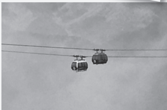
営業の再開準備のロープウェイの試運転 (早雲山～大涌谷間)