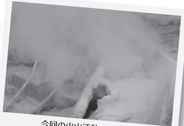
今回の火山活動の噴気孔