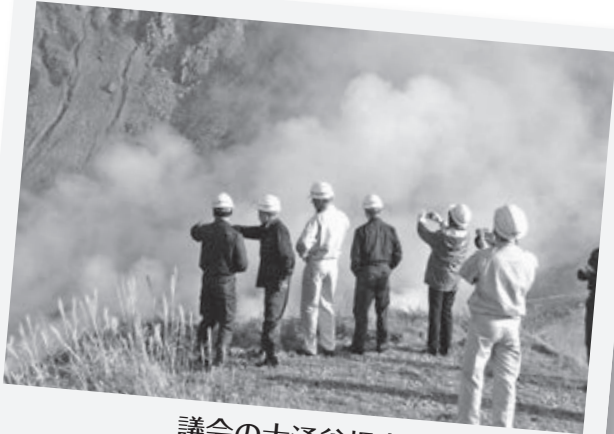
議会の大涌谷視察

箱根町議会では昨年末に大涌谷の現状の視察を実施しました。 噴気孔が増えた分、蒸気、火山ガスの発生が多くなっておりませんが 大涌谷再開に向け、多々活動しております。