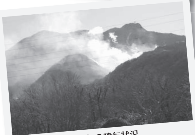
1月下旬の噴気状況、 水蒸気と硫黄煙が確認できます