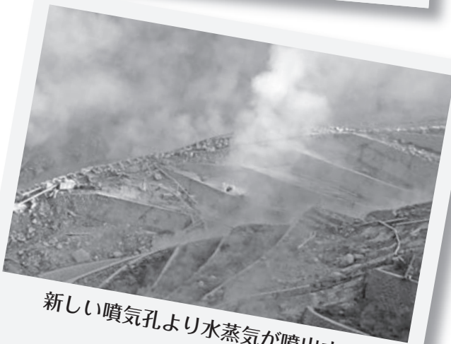
新しい噴気孔より水蒸気が噴出する