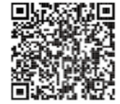
選挙公営制度ホームページ