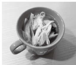
1人分の栄養価 エネルギー:63kcal 蛋白質:7.9g 脂質:2.6g 食塩相当量:0.6g

令和2年度に実施しました、「食生活に関するアンケート調査」の結果において、「朝食を作る際にかけられる平均の料理時間」は、『10分未満(41.5%)』が一番多く、次に、『30分以上1時間未満(18.5%)』、『20分未満(9.2%)』などでした。※その他を除く