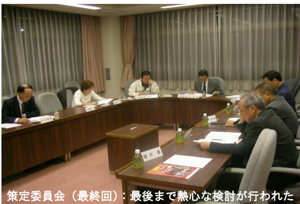
策定委員会(最終回):最後まで熱心な検討が行われた

この委員会では、制定された条例をいかに町民の皆さんへ効果的に周知していくかについて、これまでと同様に熱心な話し合いが行われました。